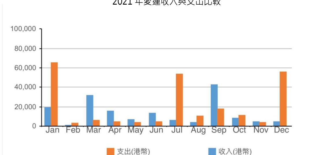
2021 年愛蓮收入與支出比較

最後，要多謝過去無論在禱告或金錢上支持的弟兄姊妹，其實一直愛蓮的支持十分足夠，但因為最近香港的變化及移民潮，影響了奉獻的支持，不單我，其實有很多宣教士的支持都不足，有些還因不足而需要返回香港。因著今年九月至十二月需要回港述職，支出相應增加，故需你們繼續禱告支持外，也考慮奉獻支持，讓我可以繼續在宣教事工努力。